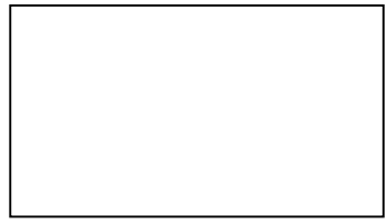
図 1 オゾン